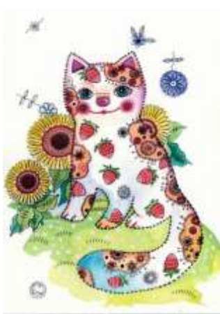
Третий этап – работа над образом